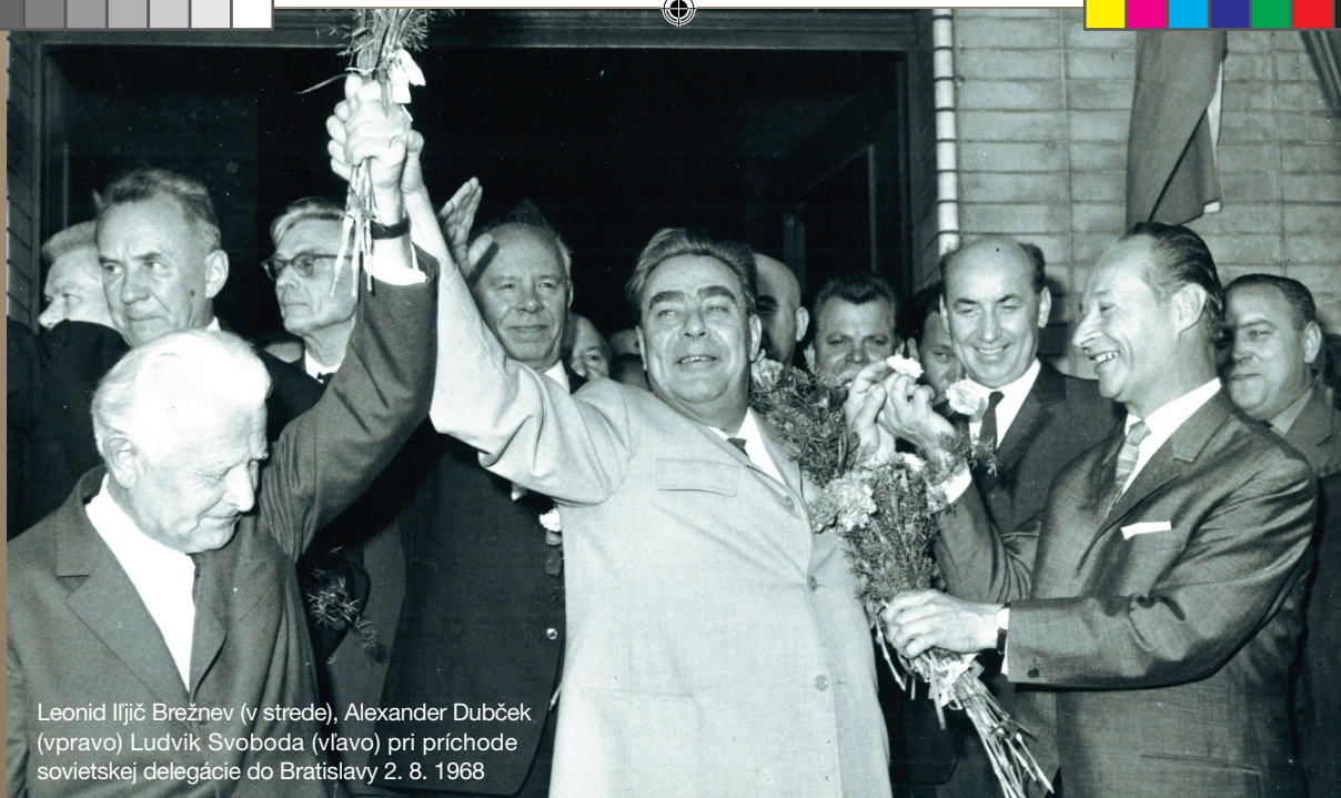
Leonid Iljič Brežnev (v strede), Alexander Dubček (vpravo) Ludvík Svoboda (vľavo) pri príchode sovietskej delegácie do Bratislavy 2. 8. 1968

Vedúci predstavitelia Sovietskeho zväzu s obavami sledovali demokratizačné snahy v Československu. Už v marci 1968 sa uskutočnila schôdzka predstaviteľov štátov Varšavskej zmluvy, na ktorej prvý raz zo strany znepokojených komunistických predstaviteľov zaznela otvorená kritika vývoja v Československu. Dubček vo svojich spomienkach uvádza, že výnimočne sa stretnutia zúčastnili i sovietski generáli. Hrozby pokračovali v podobe vojenských cvičení v Poľsku, NDR a na Šumave. Československí predstavitelia sa síce snažili zmierniť napätie rokovaním a preukazovaním dobrej vôle, to sa však nepodarilo ani na rokovaníach v Čiernej nad Tisou.