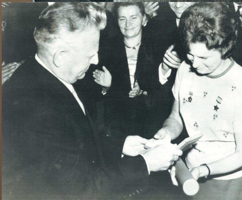
Prezident Antonín Novotný víta sovietskú kozmonautku, prvú ženu sveta vo vesmíre Valentinu Tereškovú pri jej návšteve Bratislavy v auguste 1963

V procese s tzv. buržoáznymi nacionalistami bol odsúdený a neskôr rehabilitovaný Gustáv Husák – budúci prezident Československej socialistickej republiky v rokoch 1975 - 1989