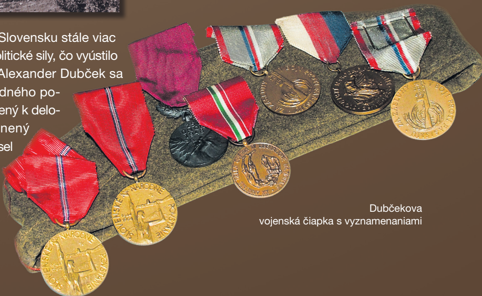
Dubčekova vojenská čiapka s vyznamenaniami