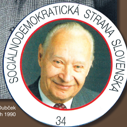
Odznak Sociálno-demokratickej strany Slovenska za ktorú Dubček kandidoval v prvých parlamentných voľbách 1990