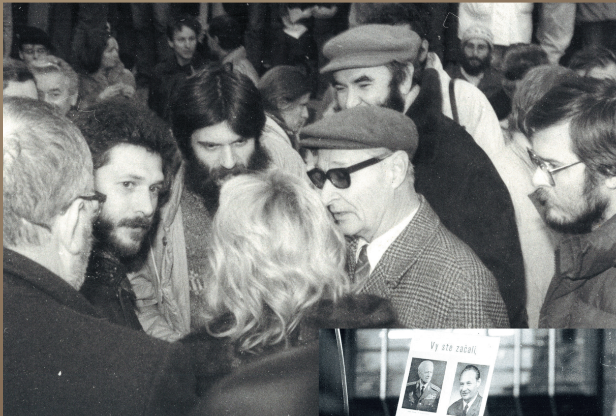
Dubček medzi ľuďmi počas demonstrácii v novembri 1989 v Bratislave

Dubček napriek sklamaniam prijal ponuku stať sa predsedom Federálneho zhromaždenia ČSFR. Túto funkciu zastával od zvolenia vo Federálnom zhromaždení 28. decembra 1989 až do svojej predčasnej tragickej smrti.