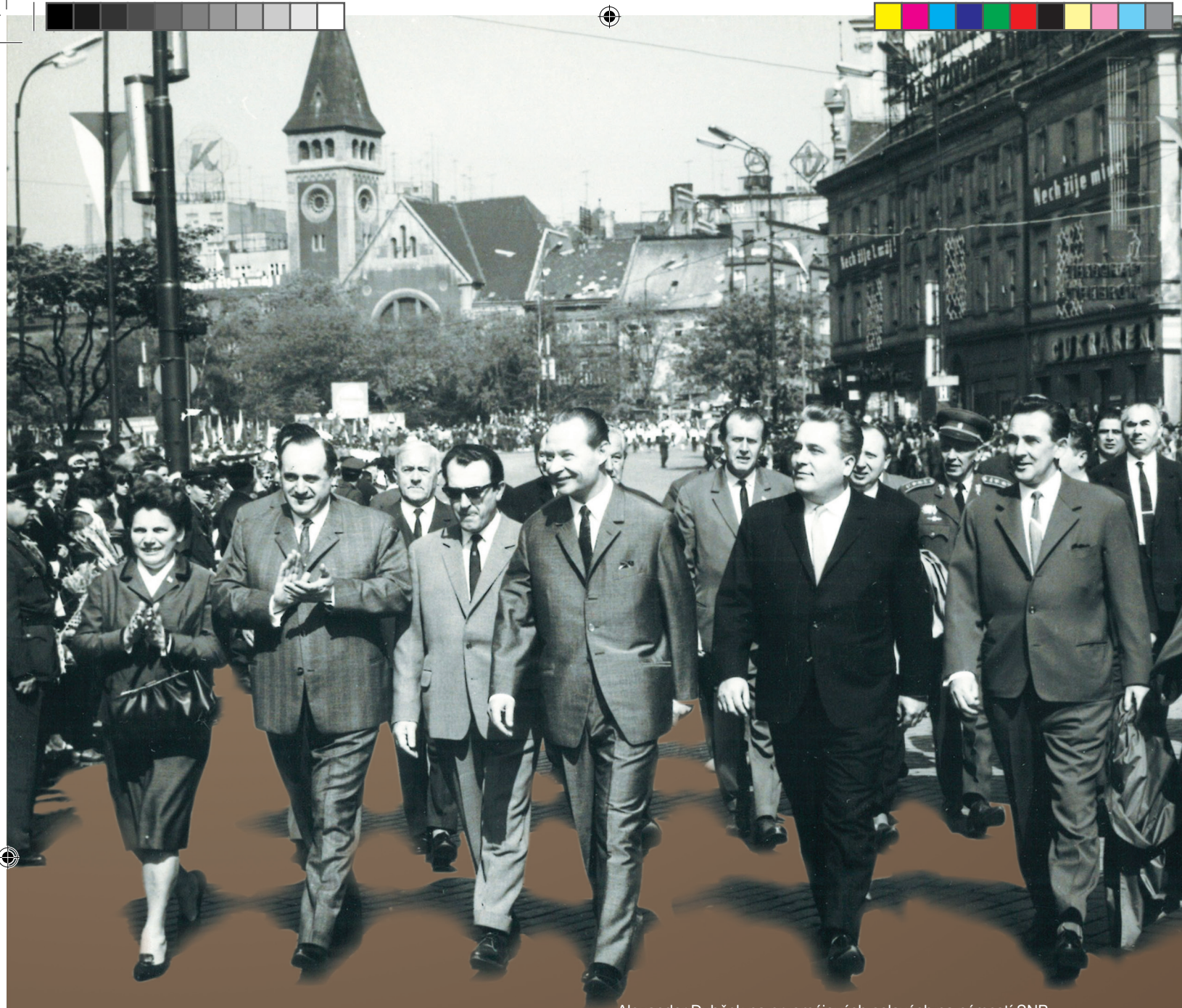
Alexander Dubček na prvomájových oslavách na námestí SNP v Bratislave v roku 1966

V Komunistickej strane Československa bolo dlhodobo zaužívané, že sa všetky personálne otázky riešili v úzkej spolupráci a po odsúhlasení s najvyššími sovietskymi predstaviteľmi. „Eto vaše delo“ - „Je to vaša vec“. To bola veta, ktorou odpovedal v decembri 1967 Leonid Iljič Brežnev, 1. tajomník ÚV KSSZ na snahu Antonína Novotného nájsť podporu v Sovietskom zväze. Touto vetou dal Brežnev vedeniu KSČ jasný odkaz. Hneď v januári 1968 Ústredný výbor KSČ odvolal Antonína Novotného z postu 1. tajomníka KSČ. Následne plénum Ústredného výboru zvolilo za nového 1. tajomníka KSČ Alexandra Dubčeka.