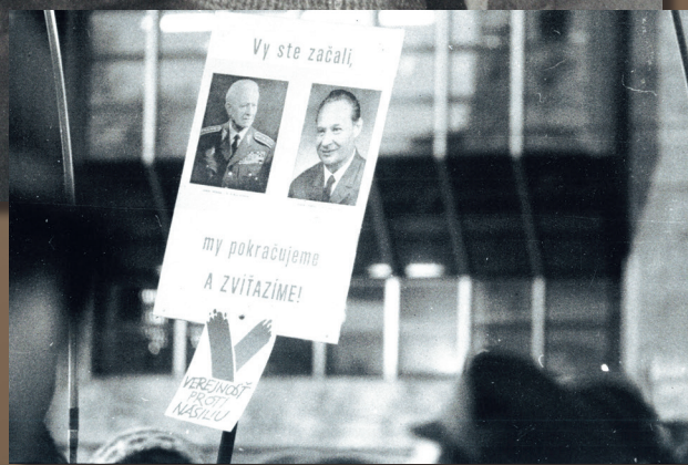
Transparent z novembra 1989

Dubček napriek sklamaniam prijal ponuku stať sa predsedom Federálneho zhromaždenia ČSFR. Túto funkciu zastával od zvolenia vo Federálnom zhromaždení 28. decembra 1989 až do svojej predčasnej tragickej smrti.