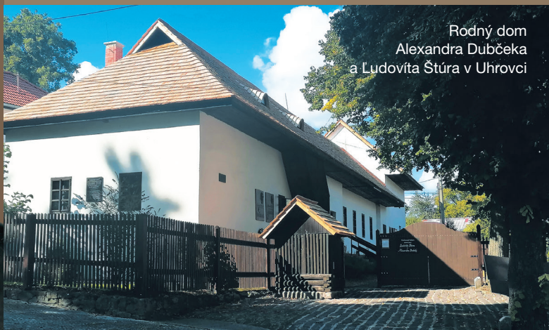
Rodný dom Alexandra Dubčeka a Ľudovíta Štúra v Uhrovci