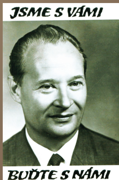
Fotografia Sme s Vami, buďte s nami!

Napriek neuveriteľnej popularite začalo po podpise Moskovského protokolu pre Dubčeka najsmutnejšie obdobie. Je to obdobie ústupkov a ústupu. 16. októbra podpísal medzinárodnú dohodu o podmienkach dočasného pobytu sovietskych vojsk. V novembri sa musel zmieriť s tým, že došlo