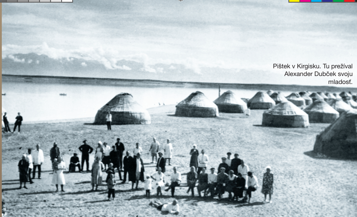
Pištek v Kirgisku. Tu prežíval Alexander Dubček svoju mladost.

Alexander Dubček neskôr spomínal na často opakovaný povzdych: „Tak tu sme na konci sveta“. Interhelpisti žili v Pišteku na jednej strane bohatým spoločenským spolkovým životom, na druhej strane sa čoraz častejšie vyskytovali prípady zatknutia členov družstva. Dospievajúci Dubček bol zrejme aj svedkom prejazdu transportu ukrajinských roľníkov – tzv. kulakov. Keď vlak zastavil v Pišteku, ktorý sa vtedy nazýval Frunze, vypadávali z otvorených vagónov mŕtvol. Dubček údajne vtedy rozmýšľal, akých zločinov sa museli dopustiť títo nepriatelia štátu, keď takto dopadli. Nedokázal pochopiť, že títo ľudia neboli trestaní za to, čo spáchali, ale za to, čím boli. Táto skúsenosť zrejme ovplyvnila budúceho politika, aby pre komunizmus hľadal ľudskejšiu tvár. Koniec koncov to, že sa človek môže stať pre komunistický režim nepohodným len pre to, čím je, musel pochopiť už v roku 1938. Vtedy nový zákon o občianstve umožnil zostať v ZSSR len cudzincom, ktorí sa vzdajú svojho pôvodného občianstva. To, že uprednostnil návrat na Slovensko svedčí o tom, že možnosť budovať socialistickú spoločnosť v Sovietskom zväze mu nestála zato, aby sa vzdal československého občianstva.