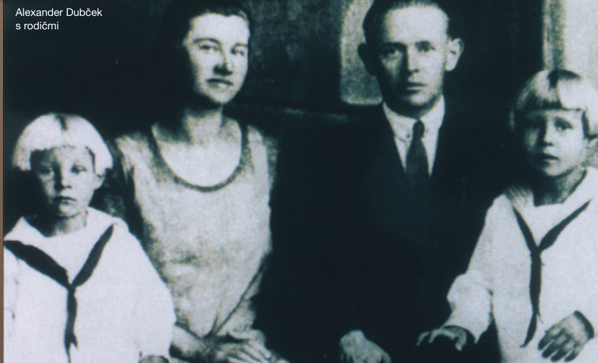
Alexander Dubček s rodičmi