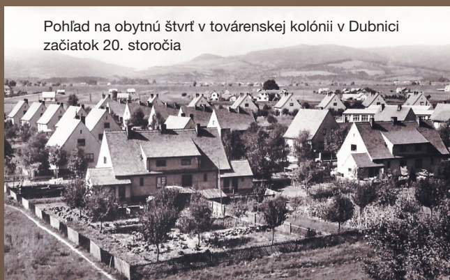
Pohľad na obytnú štvrť v továrenskej kolónii v Dubnici začiatok 20. storočia

Alexander Dubček neskôr spomínal na často opakovaný povzdych: „Tak tu sme na konci sveta“. Interhelpisti žili v Pišteku na jednej strane bohatým spoločenským spolkovým životom, na druhej strane sa čoraz častejšie vyskytovali prípady zatknutia členov družstva. Dospievajúci Dubček bol zrejme aj svedkom prejazdu transportu ukrajinských roľníkov – tzv. kulakov. Keď vlak zastavil v Pišteku, ktorý sa vtedy nazýval Frunze, vypadávali z otvorených vagónov mŕtvol. Dubček údajne vtedy rozmýšľal, akých zločinov sa museli dopustiť títo nepriatelia štátu, keď takto dopadli. Nedokázal pochopiť, že títo ľudia neboli trestaní za to, čo spáchali, ale za to, čím boli. Táto skúsenosť zrejme ovplyvnila budúceho politika, aby pre komunizmus hľadal ľudskejšiu tvár. Koniec koncov to, že sa človek môže stať pre komunistický režim nepohodným len pre to, čím je, musel pochopiť už v roku 1938. Vtedy nový zákon o občianstve umožnil zostať v ZSSR len cudzincom, ktorí sa vzdajú svojho pôvodného občianstva. To, že uprednostnil návrat na Slovensko svedčí o tom, že možnosť budovať socialistickú spoločnosť v Sovietskom zväze mu nestála zato, aby sa vzdal československého občianstva.