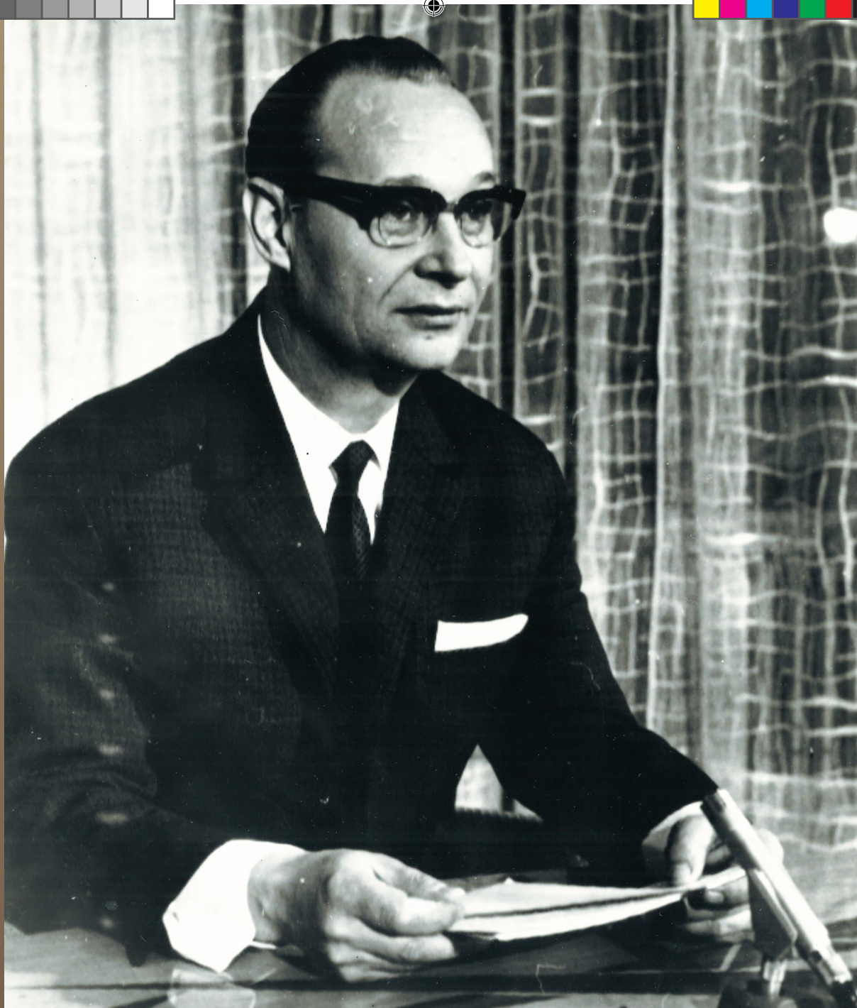
Jeden z posledných televíznych prejavov Alexandra Dubčeka 8. 1. 1969

Po odvolaní z funkcie 1. tajomníka KSČ a predsedu Federálneho zhromaždenia sa stal veľvyslancom v Turecku. Aj Dubčekovi však muselo byť jasné, že tento pomalý zostup neskončí na veľvyslanectve. V júni 1970 prestal byť pre novú moc zaujímavý a tá ho odvolala. V nasledujúcom období zažíval Alexander Dubček na vlastnej koži všetky nepríjemnosti, ktoré boli typické pre znova sa utužujúci komunistický režim. Problémy s hľadaním zamestnania, každodenné sledovanie štátnou bezpečnosťou, ktorá sa snažila o jeho izoláciu od okolia, ale aj odopieranie zdravotnej starostlivosti. Dubček vtedy pracoval za minimálny plat v Západoslovenských štátnych lesoch v Bratislave-Krasňanoch ako mechanizátor.